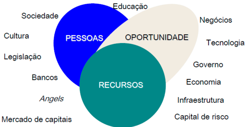
Figura 03 – Fatores favoráveis no processo empreendedor