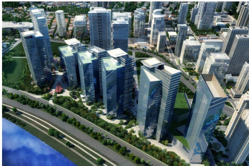
Figura 3 – Parque da Cidade. Fonte: Divulgação, 2013.

O Parque da Cidade (figura 03) localizado na cidade de São Paulo, empreendimento da Odebrecht – Realizações imobiliárias, surgiu como uma solução pela carência de áreas verdes e pela falta de interação entre as pessoas. Este complexo foi projetado para ser de uso múltiplo, onde as pessoas possam encontrar tudo que precisam de forma rápida, pelos diversos serviços agrupados no mesmo espaço, utilizando os conceitos da cidade compacta.