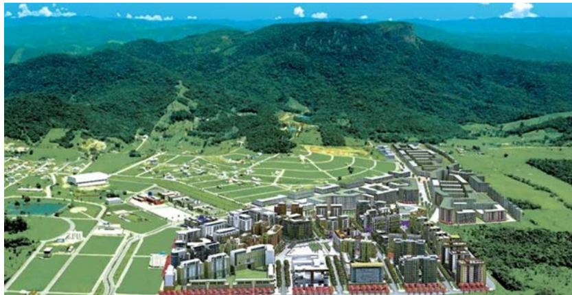
Figura 2 – Cidade universitária Pedra Branca.

A Cidade Universitária de Pedra Branca (figura 02) começou a ser construída no ano de 1997, em uma antiga região agropecuária em Palhoça/SC. No projeto arquitetônico quem está à frente é DPZ Latin America e de engenharia a Arup, com participação do Arquiteto e Urbanista Jaime Lerner. Este foi elaborado através do conceito do Urbanismo Sustentável com foco nos pedestres, nas construções sustentáveis e na qualidade dos espaços públicos. Uma cidade com infraestrutura completa (apartamentos, lojas, escritórios, universidade, escolas, bancos, restaurantes, parques, praças, hospital) ao alcance de todos.