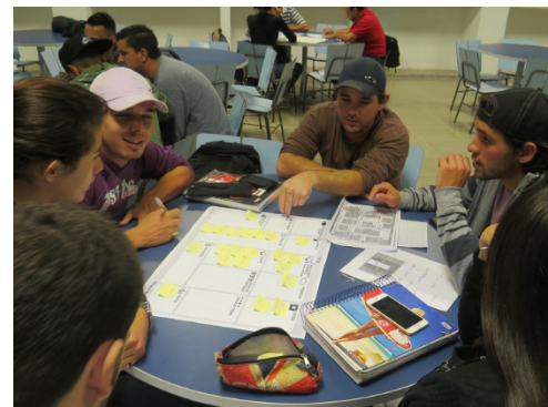
Figura 4 – Projeto em sala.