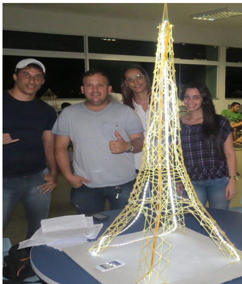
Figura 5 – Projeto dos alunos.