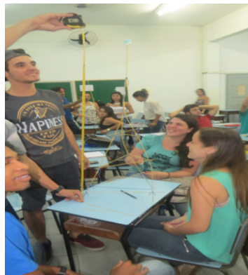
Figura 3 – Torre de macarrão.