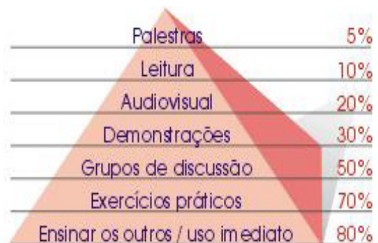
Figura 1 – Pirâmide de Aprendizagem