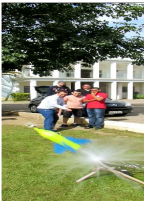
Figura 2 – Foguete com pet.

Os alunos foram estimulados a escrever artigos sobre seus projetos e apresentaram em um evento científico da IES, onde também realizaram competições de lançamento de foguete por ocasião. Os resultados obtidos até aqui (ilustrados nas figuras 2 a 6) mostram a receptividade e o interesse dos alunos pelas metodologias ativas utilizadas.